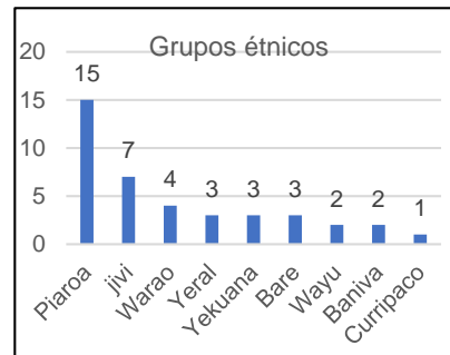
Fig II Distribución por grupos étnicos

1-Área de la salud: Concepto de salud, enfermedad, patologías y causas de muertes en las poblaciones indígenas.